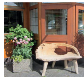
Gasthof Pension Nussbaumer

Unser Dorf Sibratsgfall liegt auf einer Seehöhe von 929 m und wird erstmals in einer Urkunde vom 19. Dezember 1511 unter dem Namen „Syfridtsgefäll“ erwähnt. Heute leben hier rund 400 Einwohner in einer intakten Natur. Wie eine pulsierende Ader zieht sich eine Linie von Nahversorgerbetrieben durch Sibratsgfall.